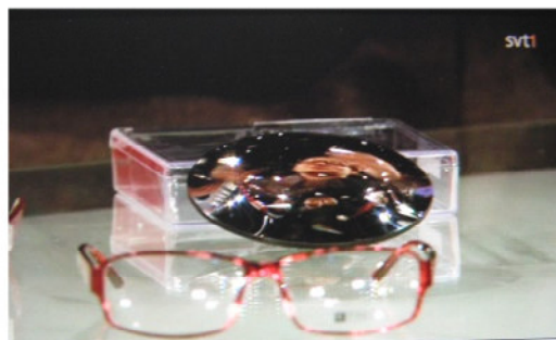
SPEGELZOOM® by awum. En förstoringsspegel för ålderssynta